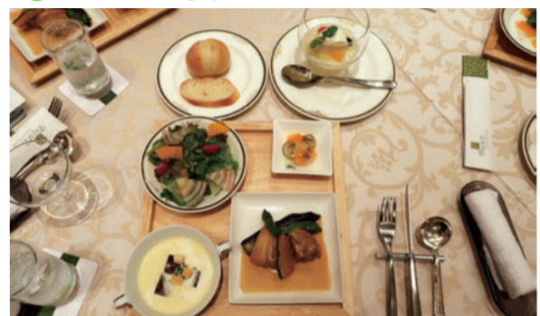
サラダ、パン2種、プーレビネグル、笹谷ニジマスのマリネ、冷たいとうもろこしのクリームスープ、デザート、コーヒー